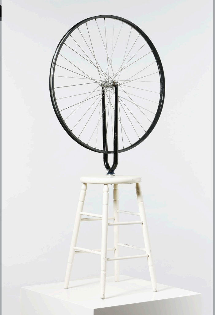
Marcel Duchamp, Roue de bicyclette (Fahrrad-Rad), (1913) 1964, Edition Galleria Schwarz, Hessisches Landesmuseum Darmstadt