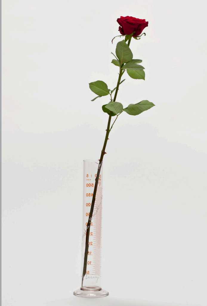
Joseph Beuys, Rose für direkte Demokratie, 1973, hrsg. von Edition Stäeck, Heidelberg, Sammlung Ballmann