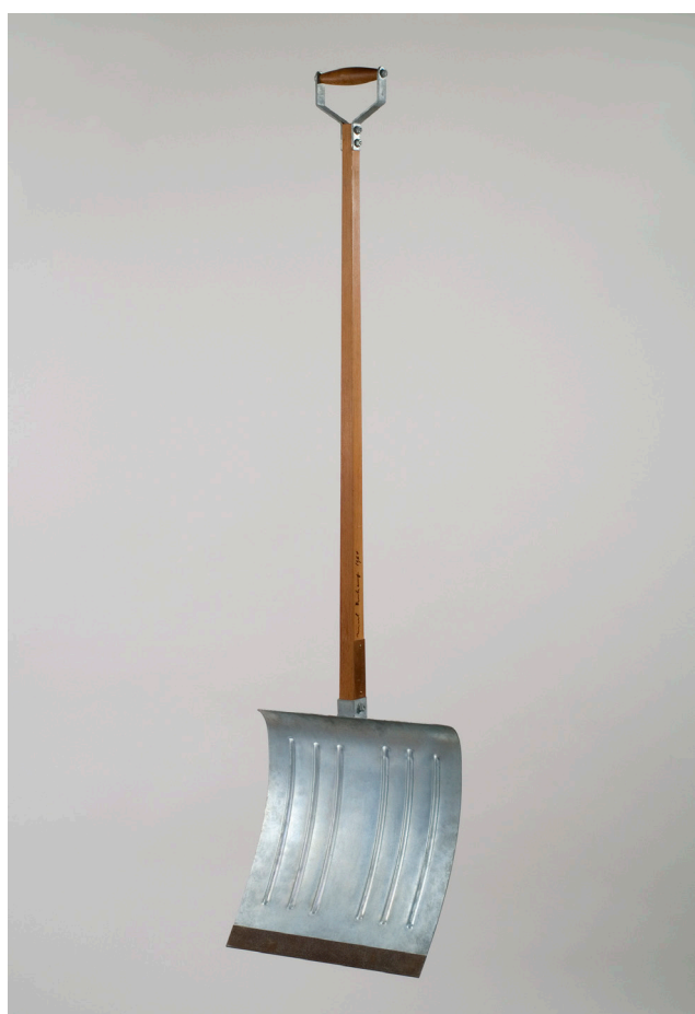
Marcel Duchamp, In Advance of the Broken Arm (Dem gebrochenen Arm voraus), (1915) 1964, Staatliche Schlösser, Gärten und Kunstsammlungen Mecklenburg-Vorpommern, Staatliches Museum Schwerin

Zur Ausstellung erscheint ein umfangreicher Katalog in deutscher und englischer Ausgabe im Hatje Cantz Verlag.