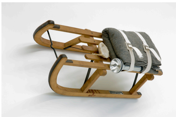
Joseph Beuys, Schlitten , 1969, Sammlung Block, Leihgabe im Neuen Museum Nürnberg, Foto: Uwe Walter, Edition Block, Berlin © VG Bild-Kunst, Bonn 2021

In the mid-1960s, just as Joseph Beuys (1921-1986) was increasingly going public with his work, the French-American artist Marcel Duchamp (1887-1968) was being discovered as a catalyst and pioneer of conceptual art by a younger generation of artists in the United States and Europe. Beuys mentioned no other artist more frequently in interviews than Duchamp, and none seemed to pose a greater challenge to him. His now iconic action The Silence Of Marcel Duchamp Is Overrated (1964) is an expression of Beuys's critical attitude towards Duchamp's distanced reserve, especially with regard to political and societal issues, whereas for Beuys, bringing about changes in people and society was the primary objective of every creative endeavour.